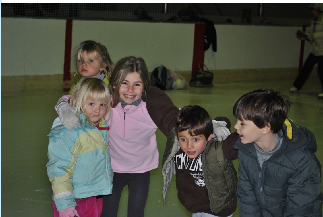
Woensdag ABC